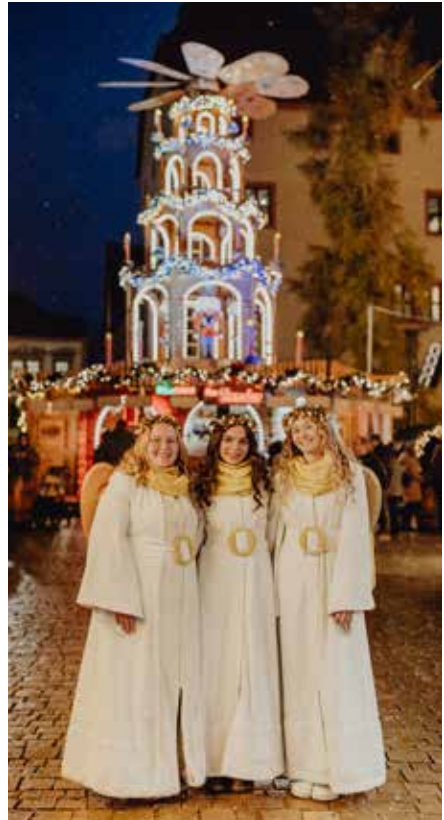
Unsere Weihnachtsengel 2023

Weihnachtslose gibt es für je 1,00 € bei der Tourist-Information in der Kaiserpfalz und in der VR-Bank, Hauptstr. 39. Täglich besteht die Chance gezogen zu werden.